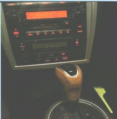
オートマチックトランスミッションとインストルメント・パネル(インパネ)