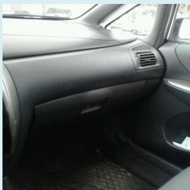
大きなグローブボックス、シートをスライドさせると脚のスペースがたっぷり。