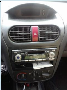
カーラジオの位置