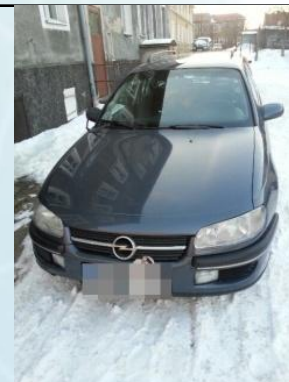
正面はとてもかっこいい